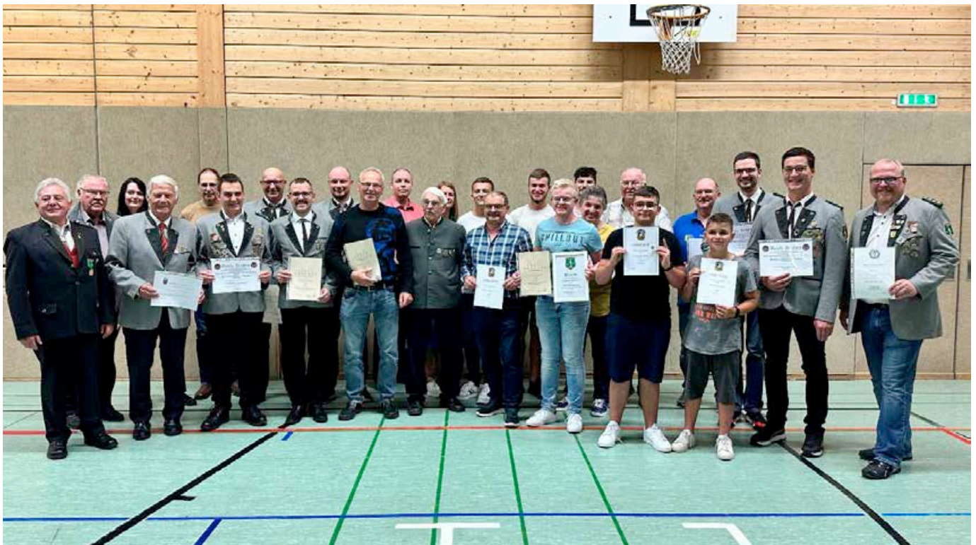
Die Jubilare und Ausgezeichneten des Abends.