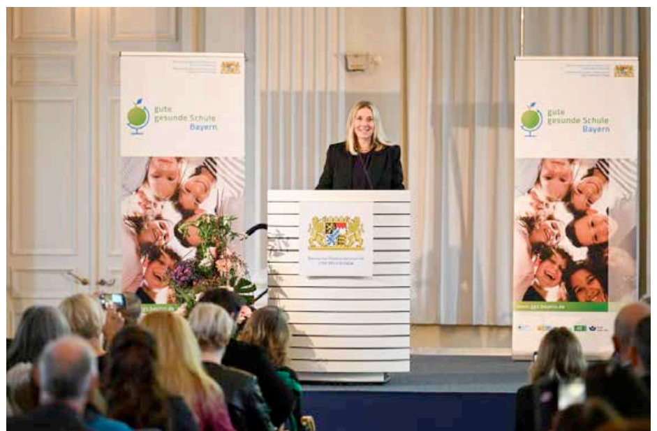
Kultusministerin Stolz bei Auszeichnungs- rede

Alle drei Schulen haben sich auch im kommenden Schuljahr zum Landesprogramm für die „gute gesunde Schule Bayern“ angemeldet und werden weiterhin gemeinsam mit der Schulfamilie und externen Partnern ein Zeichen für die Bedeutung von Prävention, Gesundheitsförderung und den dazugehörigen Kompetenzen setzen.